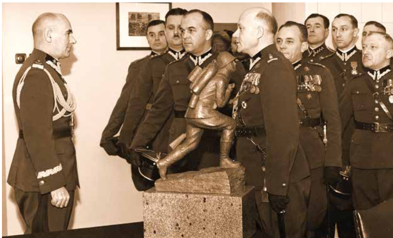
Delegacja służby łączności u marszałka Edwarda Rydza-Śmigłego. Meldunek składa płk Heliodor Ceba. Na pierwszym planie – figura żołnierza biegnącego z meldunkiem, wręczona marszałkowi w imieniu wszystkich oddziałów łączności. Styczeń 1939 r.

Wziął udział w wojnie polsko-bolszewickiej, organizował i wyposażał w sprzęt łącznościowy oddziały walczące w III Powstaniu Śląskim. W wolnej Polsce pełnił funkcje sztabowe i dowódcze, m.in. jako komendant Centrum Wyszakowania Łączności (od 1932 r.), dowódca wojsk łączności Ministerstwa Spraw Wojskowych (od 1934 r.) i naczelnym dowódcą łączności przy Naczelnym Dowództwie Wojska Polskiego (1939 r.). Po wybuchu II wojny światowej Heliodor Ceba został internowany w Rumunii, skąd przedostał się do Francji, a następnie do Anglii. Wyznaczony na szefa łączności